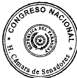
Roberto Acevedo Quevedo Presidente H. Cámara de Senadores